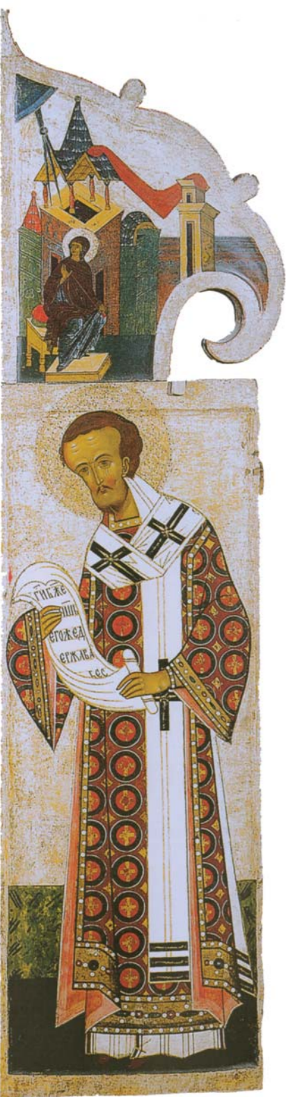
Scuola di Novgorod (1475 ca). Porte regali con raffigurazione dell'Amministrazione e di due Vesconi, Mosca, Galleria Tre'jakov.